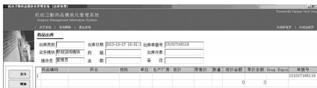
图 1 药品出库界面示例

出库: 程序自动列出所有药品, 在药品列表中选择所要出库的药品名称, 填写出库数量, 修改药品所在药箱号, 点击“保存”即可。其主要功能是在执行不同任务中对消耗的药品进行出库管理。药品出库界面示例见图 1。