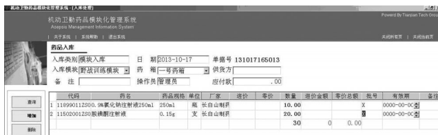
图 2 药品入库界面

4.1.2 药品入库。相应分为 3 种入库方式: (1) 模块化入库: 选择相应模块, 点击“F9”, 选择药品名称, 输入药品入库数量, 填入“药箱号”和“药品效期”后, 然后点击“保存”。(2) 药箱入库: 首先选择药品箱号, 点击“F9”, 在药品列表中选择所要入库的药品, 填写入库数量和药品效期, 点击“保存”。(3) 药品入库: 点击“F9”, 选择药品名称、规格, 填写药品模块和药箱编号, 填入数量、效期, 点击“保存”。其主要功能是对在执行不同任务中消耗的药品进行补充。药品入库界面示例详见图 2。