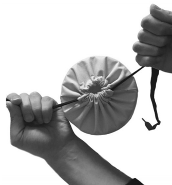
图2 打包袋实物外观图