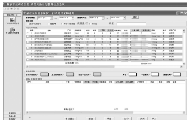
图2 门诊药房采购管理功能界面示例