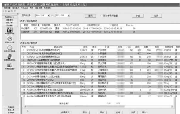
图3 药库采购管理模块功能界面示例

确认完毕后,可将本次成功验收的电子发票信息,导出成为Excel表格,作为入库导入用。④药品信息维护功能,可对医院在用、新引进及停用药品进行管理,并可以对药品进行分类标识及特定药品相关参数设置(如药品基数、权重、报警下限等)。每次医院药事管理与药物治疗学委员会形成的新药引进及停用药品决议,将由药剂科药库负责人登陆该系统,应用药品信息维护功能将新药相关信息录入到该系统中,为其分配采购基数(系统正常采购后将其值设置为“0”)、设置权重及报警限。录入完成后,该药品将在下次采购计划中产生。如果在使用中发现其计划生成量与实际使用情况存在一定差异,药库负责人将对其权重、报警限等参数进行设置,重新调整计划采购量。如果是停用药品,操作员只需登陆系统,应用药品信息维护功能将该药品信息删除,在之后的采购计划中该药品将不会出现。药库采购管理模块功能界面见图3。