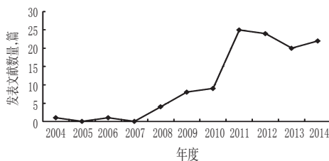
图1 2004—2014年文献年度分布情况

2004年,专业学术期刊初始刊载临床药师参与临床药物治疗会诊类型文献,题为“89例临床药学会诊资料总结” [1] 。2006年,刊载题为“药师参加1例肝移植患者用药会诊的体会” [2] 文献。2008—2010年发文量较少,但总体呈增长趋势。2011—2014年发文量大幅增加,进入相对稳定的平台期,分别为25、24、20和22篇,占比分别为21.93%、21.05%、17.54%和19.30%。2004—2014年文献年度分布情况见图1。